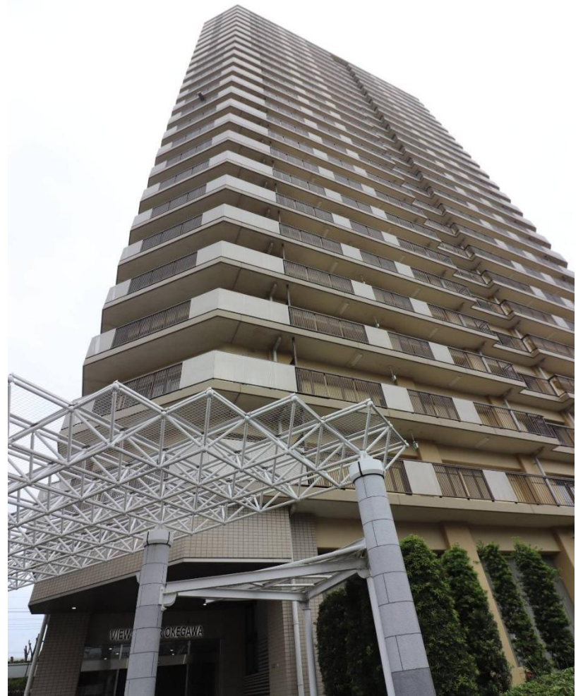
ビュータワーおけがわ。地上25階建て、高さ74.9メートル。

市民の命と安全を守るのが行政の責務です。ビル風の存在を認めず、調査すら拒む姿勢は「隠蔽」でしょうか。市は負傷者が出ている事実を重く受け止め、建物側への働きかけや、市道への植栽・フェンス設置といった安全対策を直ちに検討すべきです。