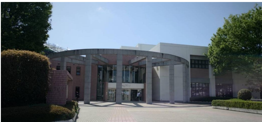
桶川サン・アリーナ。現在、障害者の団体利用についての割引はあるが、障害者の個人利用時に割引はない。

イベント開催は、当事者が集まることで市内のバリアフリーの課題を再発見する貴重な機会にもなります。障害の有無にかかわらず、誰もがスポーツを楽しめる環境づくりを求めていきます。