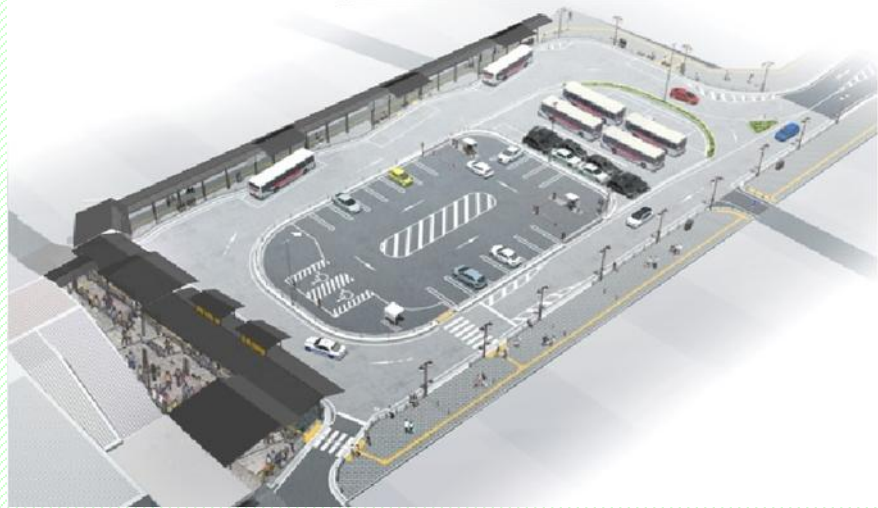
△桶川駅東口の現在の計画の全景。樹木は一切ない無機質な計画だ。(桶川市HP「桶川駅東口周辺地区の整備について」より)